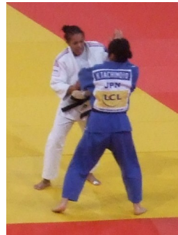
Lucie Decosse au Grand Slam de Paris-Bercy 2012

Malgré sa défaite à Bercy en ce début d'année, Lucie part grande favorite pour les J.O. de Londres. Allez Lulu !