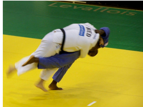
Teddy place son Tokui waza : Harai goshi